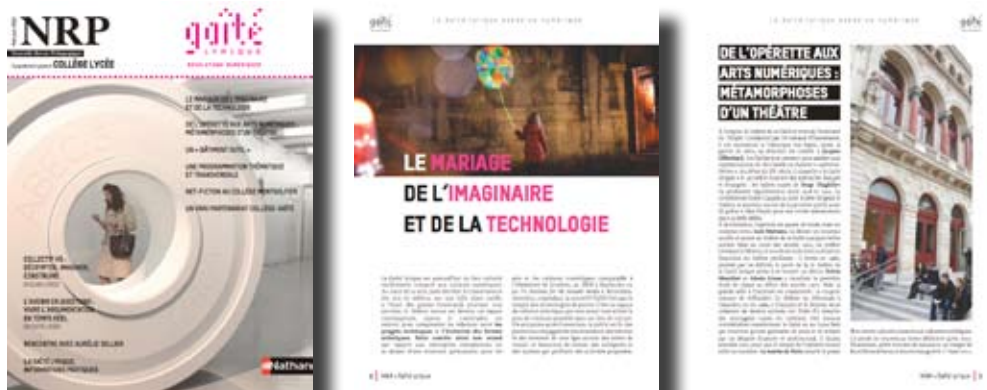
Exemple de réalisation d'un supplément éditorial pour La gaîté LYRIQUE.